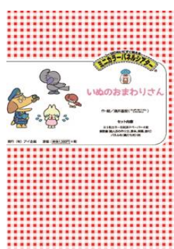
いぬのおまわりさん