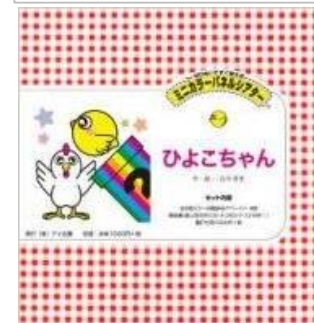
パネルでマジック「ひよこちゃん」