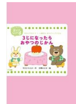
3じになったらおやつのかん