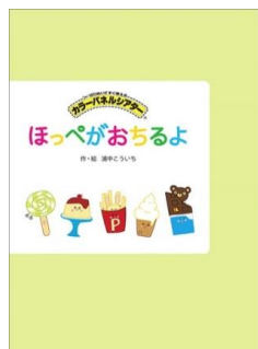
ほっぺがおちるよ