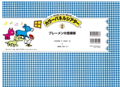
ブレーメンのおんがくた