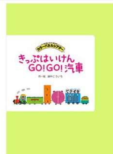
まっふはいけんGO!GO!汽車