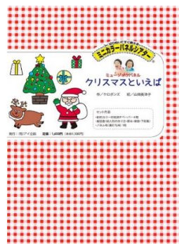
クリスマスといえば