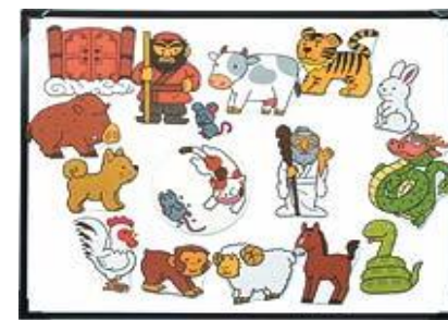
十二支のおはなし