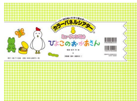
ひよこのおかあさん