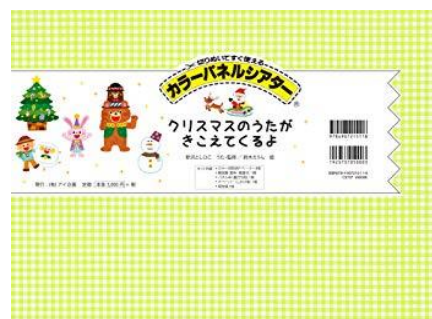
クリスマスのうたがきこえてくる