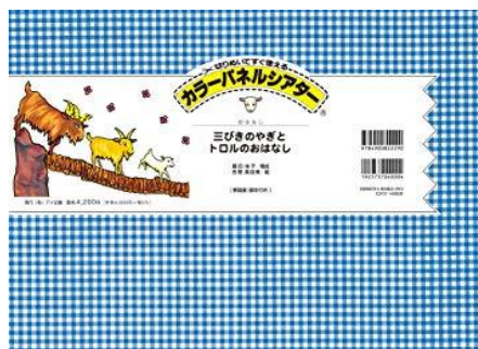
三びきのやぎとトロルのおはな