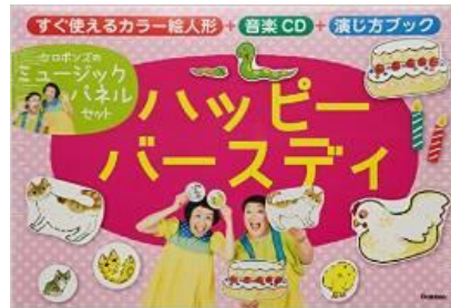
ハッピーバースディ